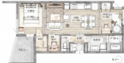
LDKのワンルームタイプ・キッチン、バス、トイレ、洗面台、玄関、収納スペース、バルコニー